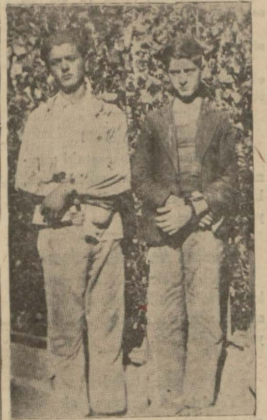
Katil Rasim ve Sâlegman [Tafsilât 3 üncü sayfada]

Yeni kurulan İş ve Ziraat (Devamı 11 inci yüzde )