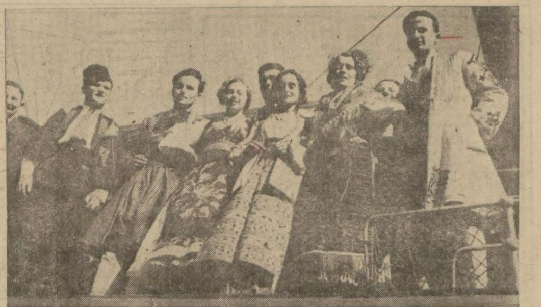
Festivalde Balkan uluslarını temsil edenler dün Büyükdaya hareket ederlerken [Yazısı yedinci sayfada]