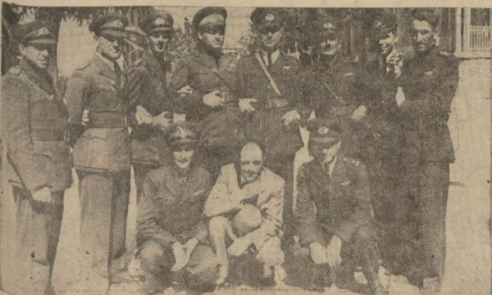
Kahraman tayyarecilerimiz Türk hava tairunu, göğüslerimizi kabartacak bir muvaffakiyetle başarıp bitirdiler. Burada dün Yeşilköye dönem havacılarımızı görüyorsunuz. [Yazısı 8 inci sayfada]